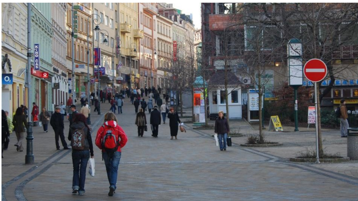
Figura 2 – Espaço peatonal em uma pequena cidade da República Checa – Acessível, Autônomo, Sociável e Habitável.

A partir destes marcos, a mobilidade urbana começa a ser debatida e estudada, para a criação dos PMUS (Planos de Mobilidade Urbana Sustentável) ii , como sendo um conjunto de atuações, com o objetivo de implantação de formas de deslocamento mais sustentáveis (caminhar, bicicleta e transporte público) dentro de uma cidade, quer dizer, de modos de transporte que façam compatível crescimento econômico, coesão social e defesa do meio ambiente, garantindo desta maneira, uma melhor qualidade de vida aos cidadãos.